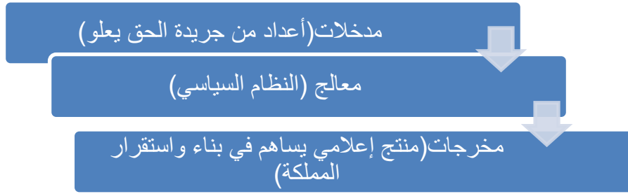
شكل ٢: نموذج العلبة السوداء لديفيد إيستون

يمثل نموذج العلبة السوداء بمثابة المقاربة النظرية الأنسب لتفسير موضوع البحث، وإسقاط مختلف المفاهيم الرئيسية المحيطة به، فالمدخلات المتمثلة في مضامين جريدة "الحق يعلو" من مقالات رأي، وآراء أهل الاختصاص تُعدّ بمثابة الخطوة الأولى المساهمة في تكوين الصورة الذهنية العامة لهذه المملكة وفق رؤى الملك الراحل، بينما يمثل النظام السياسي دور المعالج لكل المدخلات، مما يجعله المساهم الأول في الحفاظ على المنظومة التربوية والنهضوية التي انبنى عليها مشروع المملكة، وهذا ما يسمح بالحصول على مخرجات أو نتائج تتماشى والمدخلات التي أدرجت في هذا السياق.